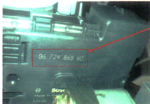
شماره حک شده