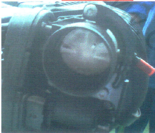
دریچه گاز پلاستیکی

الف- دریچه گاز پلاستیکی با کد اختصاصی ۰۷۴۰۴۰۱۱ و شماره حک شده روی بدنه دریچه گاز ۹۶۶۱۸۰۹۰۸۰ برای ECU با نرم افزارهای ۹۶۶۳۹۱۰۰۸۰ و ۹۶۶۳۸۱۰۲۸۰