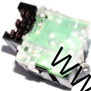
نام قطعه: واحد کنترل برف پاک کن شماره سریال: ۸۰۲۱۰۷ شماره عملیات جهت تعمیرات: ۹۳۱۲۵ R۰۰