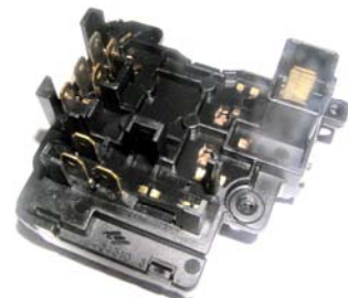
نام قطعه: واحد کنترل چراغ شماره سریال: ۸۰۲۱۰۶ شماره عملیات جهت تعمیرات: ۹۳۱۲۴ R۰۰