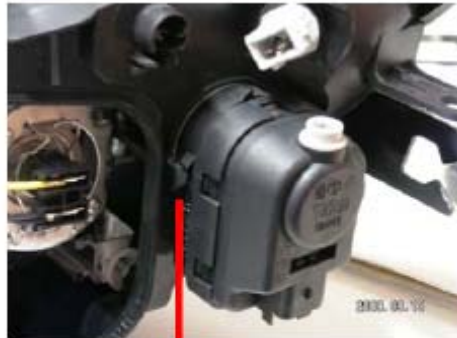
قفل صحیح موتور بر روی چراغ

عنوان: دروش تعویض اجزاء چراغ جلو (لامپ و موتور)