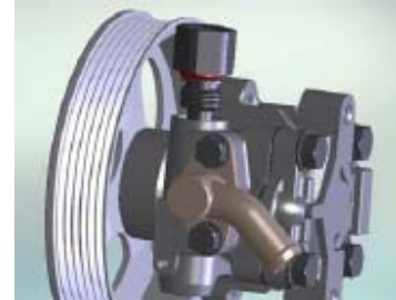
اورینگ کانکتور به شماره فنی 01715012

1-5- سرنگ حاوی مایع شوینده (الکل یا TCE) را با فشار از اسپول و سوراخ بغل اسپول عبور دهید. آلودگی های روی صافی را با شناور کردن اسپول داخل مایع شستشو و تکان دادن آن برطرف نمایید. توسط فشار باد اسپول را کاملاً تمیز نمایید.