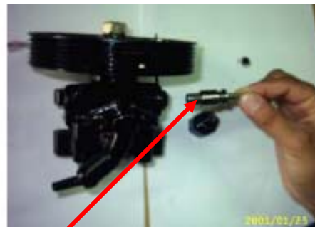
اسپول و فنر

1-4- مطابق تصاویر صفحه بعد توسط سرنگ مایع شوینده (الکل یا TCE) را با فشار از کانکتور عبور دهید در این شستشو از باز بودن سوراخ بغل کانکتور اطمینان حاصل نمایید سپس با فشار هوا کانکتور را کاملا تمیز نمایید .